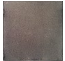
ZINCALUME® steel (No Sign of Rust)

การทดสอบผลิตภัณฑ์ในสภาพแวดล้อมกลางแจ้งที่มีการกัดกร่อนสูงเป็นเวลา 6 ปี