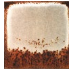
Galvanized steel Z275 (Heavy sign of Rust)

Atmospheric exposure tests and 30 years of manufacturing confirm ZINCALUME® steel has corrosion resistance far superior to that of ordinary zinc coatings. ZINCALUME® steel may last up to 4 times longer than traditional galvanized material in an identical environment.